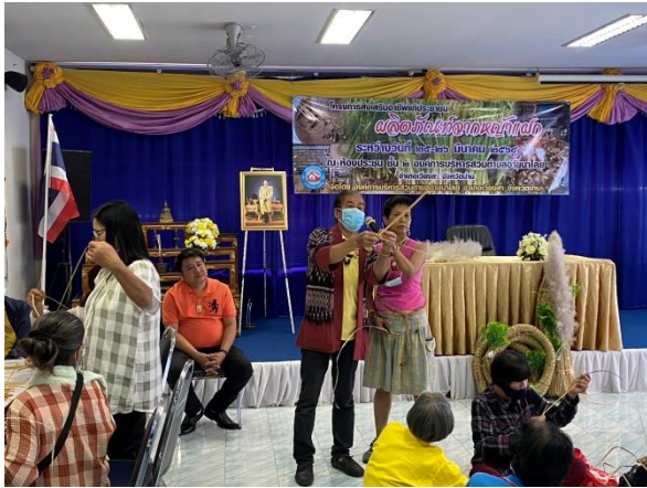
เป็นวิทยาทานให้แก่ผู้เข้าอบรม ของ อบต.อายนาไลย