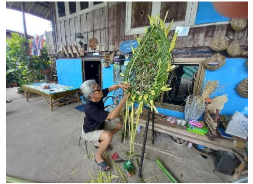
งานฝีมือจากใบมะพร้าว