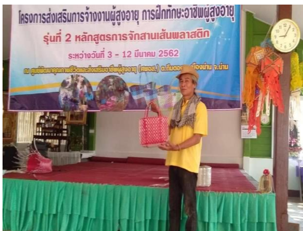
วิทยากรสาธิตผลิตภัณฑ์จากเส้นพลาสติก