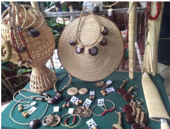
ผลิตภัณฑ์จากหญ้าแฝก