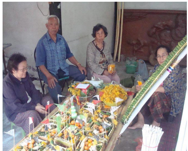
การทำสวดสงเคราะห์