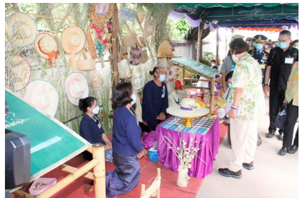
ตัวแทนราษฎรนำเสนอผลิตภัณฑ์จากไม้ไผ่