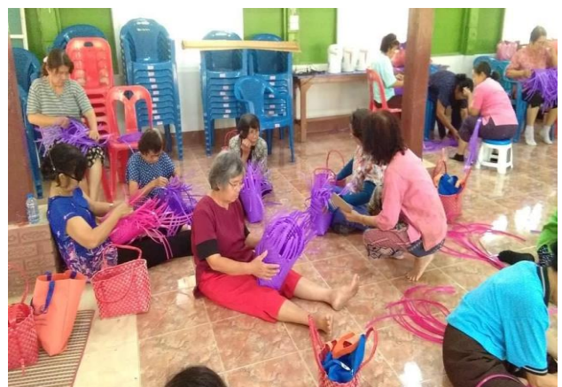
วิทยากรสาธิตผลิตภัณฑ์จากเส้นพลาสติก