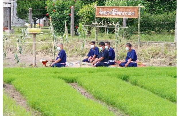
การทำพิธีสงเคราะห์นา

เมื่อครั้งสมเด็จพระกนิษฐาธิราชเจ้า กรมสมเด็จพระเทพรัตนราชสุดาฯ สยามบรมราชกุมารี เสด็จทรงงาน ณ ตำบลถ้ำทอง