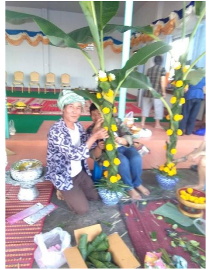
งานฝีมือจากใบตอง