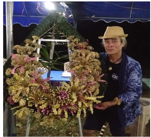
ผลิตภัณฑ์จากหญ้าแฝก